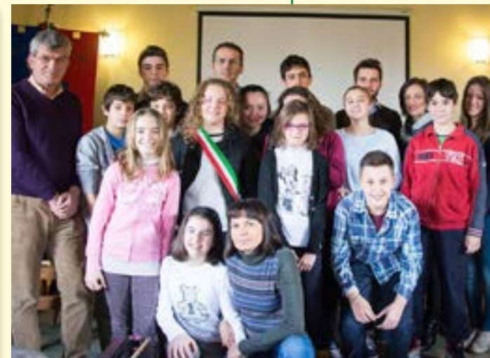
Consiglio comunale dei ragazzi.