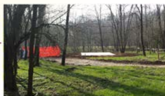
La piattaforma che accoglierà la tettoia nei pressi dell'area dove si organizzano le feste di valle