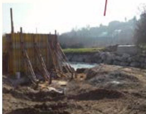
Il rifacimento del ponticello nei pressi dell'area dove si organizzano le feste di valle a Gorla