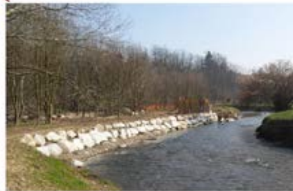
La sponda ricostruita che era stata distrutta dall'alluvione del 2014