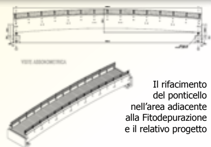
Il rifacimento del ponticello nell'area adiacente alla Fitodepurazione e il relativo progetto