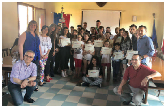
Premiazione concorso "Seminiamo il rispetto"

Oltre a questi incontri verrà proposto un concorso rivolto a tutti i Gorlesi, aperto sia alle realtà educative ed associative locali, sia ai singoli cittadini. In un momento culturale dove i cosiddetti "haters" (odiatori) spopolano con cinismo sui social media e usano le parole per attaccare e ferire le persone, vogliamo proporre un modo di usare le parole per costruire, per far emergere il bello e per ringraziare, perché dire grazie non è solo un atto di gentilezza e di buona educazione, ma è anche un modo per valorizzare e rispettare le persone che ci stanno accanto.