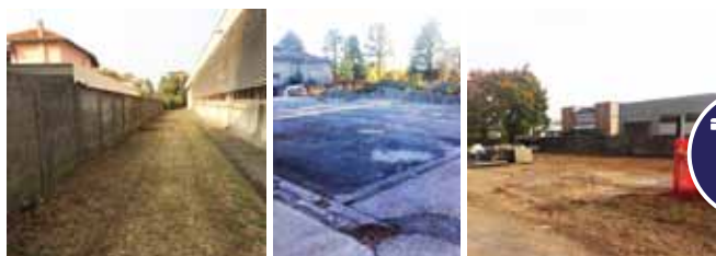
AREA TSG - PULIZIA e SMALTIMENTO COPERTURA in AMIANTO