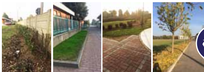
MANUTENZIONE STRAORDINARIA DEL VERDE