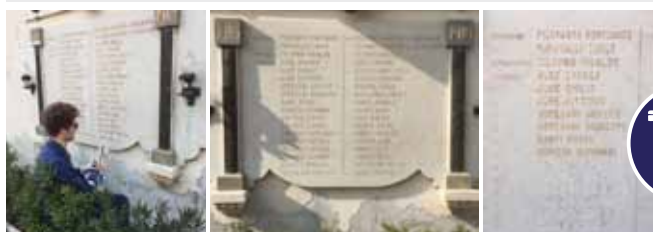
RIPRISTINO DEL MONUMENTO DEI CADUTI