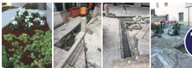
MANUTENZIONE STRAORDINARIA DI PIAZZA MARTIRI