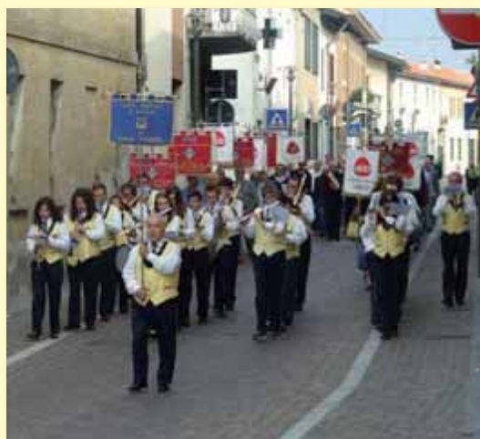
La Banda Santa Cecilia a Solbiate Olona lo scorso 16 settembre per i 50 anni della sezione locale dell'Avis-Aido

LE ISCRIZIONI SONO APERTE PUOI ISCRIVERTI SUBITO