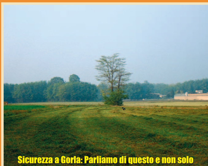
Sicurezza a Gorla: Parliamo di questo e non solo