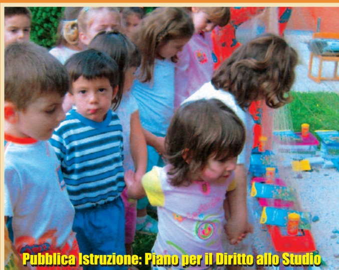
Pubblica Istruzione: Piano per il Diritto allo Studio