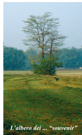
L'albero dei ... "souvenir"

Quando ci sentiamo dire che il problema non riguarda il nostro territorio comunale, la prima reazione è un sorriso. Difatti riteniamo che i confini delimitati da un cartello stra-