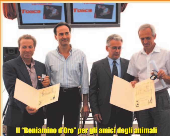
Il "Beniamino d'Oro" per gli amici degli animali