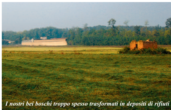
I nostri bei boschi troppo spesso trasformati in depositi di rifiuti