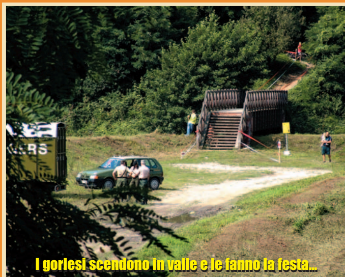
I gorlesi scendono in valle e le fanno la festa...