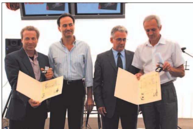
Il momento della consegna dei Beniamini d'Oro e nella foto sotto i "Beniamini Friends" cantano "Portami a casa"