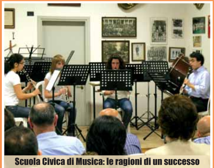
Scuola Civica di Musica: le ragioni di un successo