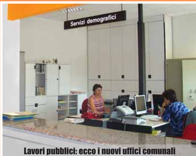
Lavori pubblici: ecco i nuovi uffici comunali