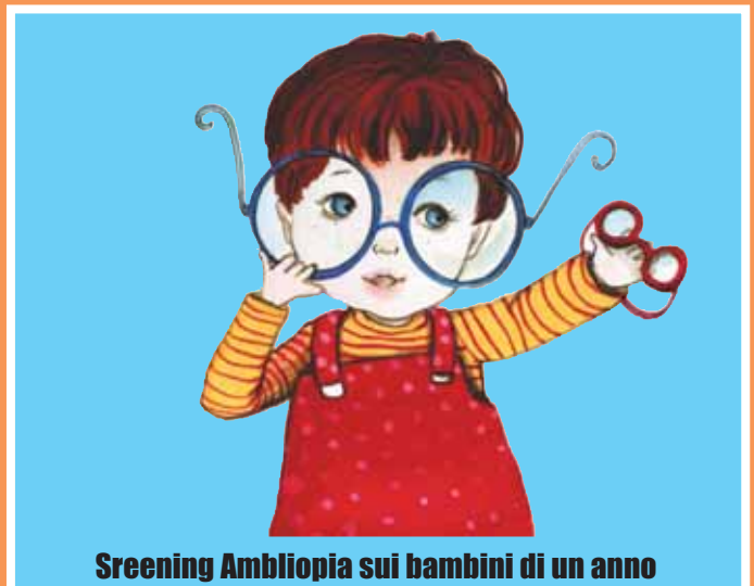
Screening Ambliopia sui bambini di un anno