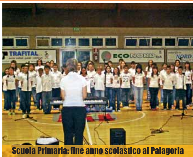
Scuola Primaria: fine anno scolastico al Palagorla