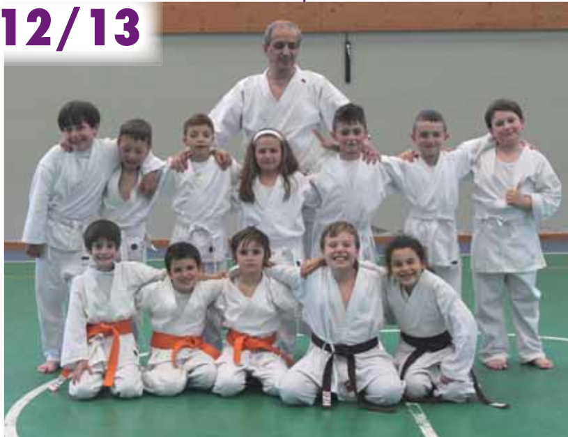
Sho Bu Kan Karate Gorla Maggiore

Come di consueto, ricordiamo che gli allenamenti riprenderanno a settembre.