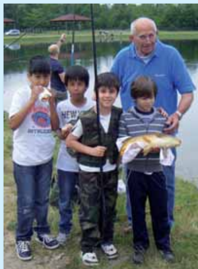
A.D.P.S. Gorla Maggiore