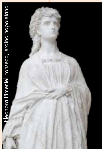
Eleonora Pimentel Fonseca, eroina napoletana