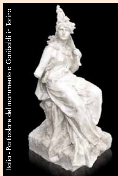
Italia - Particolare del monumento a Garibaldi in Torino