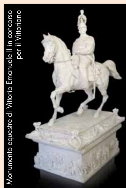
Monumento equestre di Vittorio Emanuele II in concorso per il Vittoriano